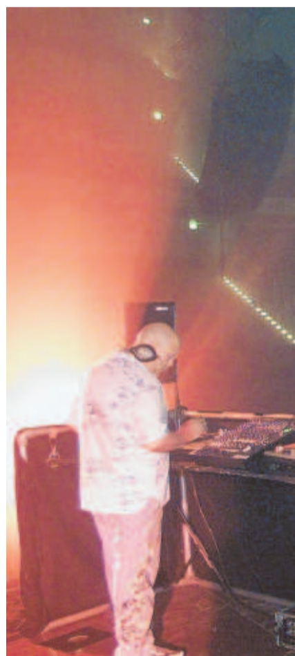
Mark Spoon bei der Arbeit.

Nun ist er tot. Ist damit auch Techno tot? Natürlich nicht. Alle anderen haben die Strapazen des Geschäfts bisher ja überstanden. Allerdings war Mark Spoon typisch für die DJs, die Anfang der Neunziger Techno mitaufbauten: Einer, der neben der Musik auch sich selbst zum Mittelpunkt der oft tagelangen Massenraves machte. Heute wirken die DJs unscheinbarer, gefeiert wird in kleinen Clubs, aber gefeiert wird noch kräftig, keine Frage.